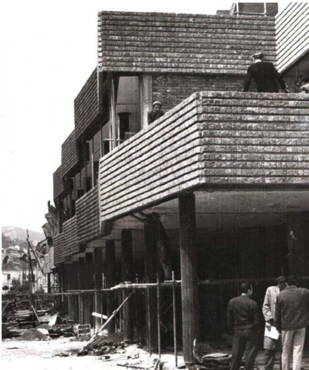
Slika 09. Robna kuća „Progres“, tokom izgradnje, jugoistočni izgled (1960)

Sa juga i zapada parapetne trake se pružaju u cik-cak liniji koja prati mesta skeletne konstrukcije. Takođe, na ovom delu se poklapaju linije parapeta mezanina i potkrovlja. U istočnom delu linije parapetnih traka se ne poklapaju kako bi se formirala terasa na koju se pristupa rampom sa trga. Prostor između parapetnih traka je popunjen sa staklom postavljenim u metalni ram. Parapetna traka je obložena sa granitnom kockom sa naglašenom horizontalnom spojnicom koja dodatno pojačava horizontalni pokret forme.