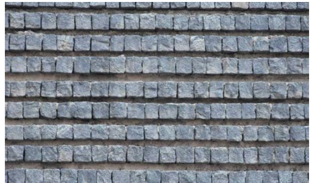
Slika 10. Robna kuća „Progres“, detalja fasade (2013)

Objekat je važan deo kompleksa Trga partizana u Užicu i važan dokument o razvoju arhitekture u Srbiji te se do daljnjeg u njegovom održavanju i eventualnim intervencijama na njemu treba uzdržavati od nepromišljenih zahvata.