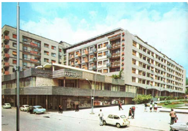
Slika 01. Robna kuća „Progres“, jugoistočni izgled (1961)

Prema prvom rešenju, objekat Robne kuće se pruža do granice kolovoza, dok se objekat bloka „Zapad“ ravno šruža celom širinom bloka. Objekat Robne kuće je spratnosti prizemlje + sprat i prema trgu ima na spratu predviđenu terasu na koju se pristupa kosom rampom sa platoa trga. Objekat ima naglašene stubove koje se pružaju kroz dve etaže dok krov izlomljeno pokriva celu površinu. U prizemlju se nalazi trem koji pokriva trotoar u ulici Dimitrija Tucovića. Tako da se u okviru ovog prvog rešenja postoji nekoliko ideja koje su razrađene i unapređene u drugom rešenju po kome je sagrađen objekat.