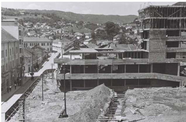
Slika 03. Robna kuća „Progres“, tokom izgradnje, istočni izgled (1960)

Duž pokrivenog trema ka ulici Dimitija Tucovića su formirani izlozi i na zanimljiv način rešen ulaz u prostorije Robne kuće. Nakon stupanja u unutrašnjost robne kuće saobraćaj se vodi po prizemlju ili stepeništem ka spratu. Unutrašnjost sadrži veliki dvoetažni prostor unutar koga se slobodno trasira putanja stepeništa.