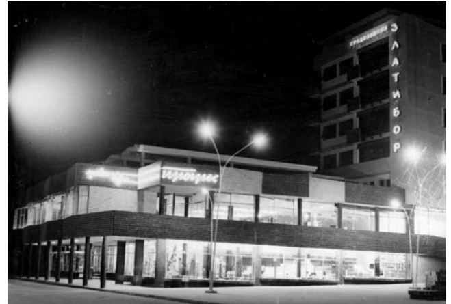
Slika 08. Robna kuća „Progres“, jugoistočni izgled noću (1961)

Spratnost objekta je prizemlje, mezanin i potkrovlje. Objekat pokriva celokupnu širinu trottoara pored ulice Dimitrija Tucovića tako da pešački saobraćaj prolazi kroz trem objekta a pored povučenog dela fasade koji se sastoji od niza izloga. Kroz sredinu objekta prema severu prolazi pasaž koji povezuje trem sa dvorištem bloka.