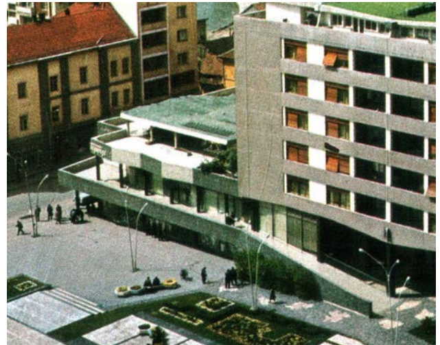
Slika 06. Robna kuća „Progres“, kosa rampa veza prve etaže sa parterom (1961)

Oblikovanjem parapeta je naglašen horizontalni pokret koji se pruža kroz tri fasade a dodatno je utisak horizontalnosti pojačan kroz način oblaganja gde su naglašene horizontalne spojnice. Međuprostor između parapeta je obrađen u staklu koje je postavljeno na metalne okvire. Parapeti se međusobno svojom geometrijom poklapaju na mestima gde se staklasadna ravan dovodi u ravan parapeta. Na mestima gde se ne poklapaju parapeti formirana je terasa gde jedan i drugi parapet imaju sasvim različite putanje a sve sa namerom da se nalgasi pokret koji ima određenu ulogu i funkciju celokupnom utisku o prostoru.