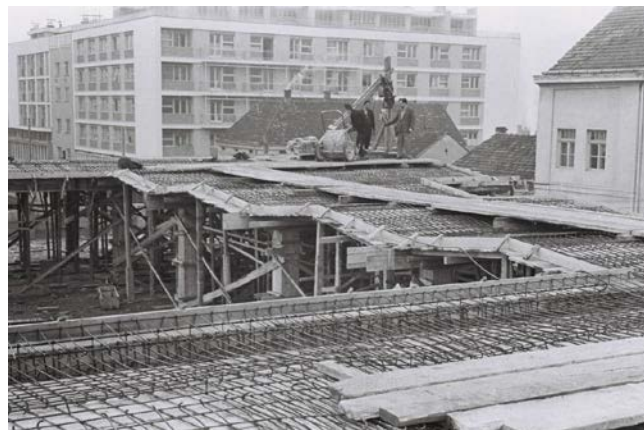
Slika 04. Robna kuća „Progres“, tokom izgradnje, detalj (1960)

Na prvom spratu se nalazi deo prostora koji je zatvoren i pruža se celom dubinom objekta i na njega se pristupa unutrašnjim stepeništem. Prema Trgu partizana se nalazi široka galerija na koju se pristupa preko kose rampe sa prostora platoa ispred stambenog bloka „Zapad“ sa platoa trga. Na ovaj način je povezan prostor partera trga sa građenim površinama u objektima oko trga, u ovom slučaju „na“ objektu. Ovako formiran prostor je otvoren i vizuelno potpuno orjentisan ka trgu i sadržajima na njemu. Na poslednjoj etaži, nazvanoj potkrovlje, formiran je prostor za poslastičarnicu sa širokom terasom sa koje se pruža pogled ka trgu i ka saobraćajnici na jugu. Ovaj prostor je delom nadkriven.