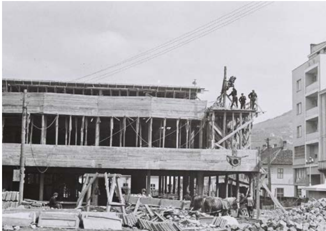
Slika 05. Robna kuća „Progres“, tokom izgradnje, zapadni izgled (1960)