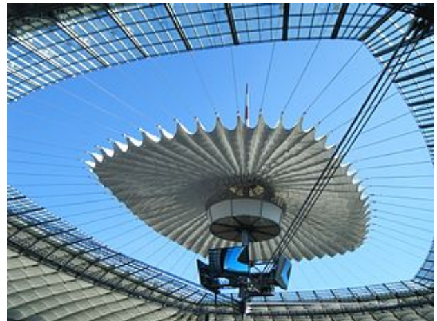
Slika8 - Izgled pokretnog krova

Fasada stadiona sastoji se od žičanih, obojenih elemenata od epoksiranog metala. Korišćenje ovakvih žičanih elemenata, čini dizajn fasade ekološki održivim dozvoljavajući upad sunčeve svetlosti i prirodnu ventilaciju stadiona, što pomaže održavanju optimalne toplote unutra, naročito kada je pokretni deo krova zatvoren [7].