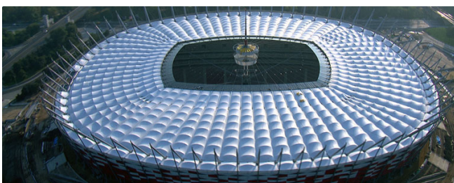
Slika7–Izgled otvorenog krova

Dimenzije stadiona su 310x280 metara a zapremina iznosi milion kubnih metara, dok površina iznosi 204.000 metara kvadratnih. Ovaj stadion ima jedan od najvećih pokretnih krovova na svetu [7]. Krov ima nezavisnu strukturu od ostalog dela stadiona a sastoji se iz mreže zategnutih kablova obloženih PTFE membranama i to je fiksni deo krova površine 55.000 m 2 , i pokretni deo krova koji je obložen PVC poliesterom, površine od 11.000 m 2 . Između ova dva segmenta nalazi se stakleni deo krova površine 4000 m 2 , širine 8 m. Najzanimljiviji segment ovog stadiona je upravo taj pokretni krov koji se otvara iz malog gnezda koji se nalazi u centralnom delu iznad terena.