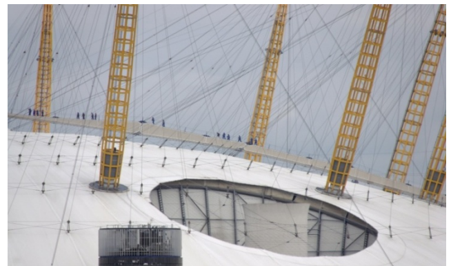
Slika5 - Ventilaciona rupa

Koncept konstrukcije je vrlo jednostavan. Zategnuti čelični kablovi su radialno raspoređeni na površini kupole i povezani su u čvorovima kablovima na intervalima od 25 m, koji polaze iz gornjih tačaka visokih stubova. Svaki od 12 stubova je dug 90 m i težak oko 95 tona. U preseku stub formira osmougaonu formu, a sačinjen je od čeličnih, kružnih, šupljih profila [10]. Prilikom montaže objekta prvo su postavljeni stubovi, nakon toga je počelo postavljanje kablovske mreže koja je montirana na mestu građenja objekta a potom podignuta na određenu visinu bez korišćenja kranova. Ovi kablovi su podignuti specijalnim uređajima koji su se nalazili na samoj konstrukciji. Sledeći korak je bila postavka pokrivača od PTFE membrana.