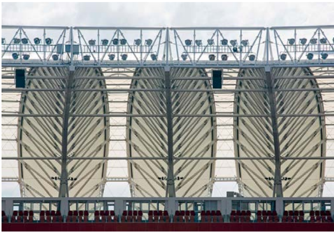
Slika1 - Prikaz konstrukcije stadiona

metara. U sklopu stadiona ulaze i neki od pratećih objekata kao što su maloprodajne prodavnice, muzej, restoran, vip prostor i ceo nivo apartmana [4]. Konstruktivni sistem se sastoji od čeličnih rešetki, koje okružuju arenu i formiraju elipsasti oblik, a obložene su PTFE membranama. Originalni pristup dizajnu ovog stadiona omogućuje posmatračima sagledavanje forme na neobičan i upadljiv način, a najzanimljiviji deo objekta je fasada u obliku palminih listova.