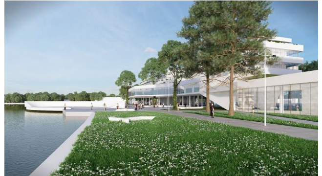
Slika 6 – Trodimenzionalni prikaz kompleksa

Materijalizacija objekata je krajnje jednostavna i svedena, sa završnom obradom spoljne opne od cement-kompozitnih panela u beloj boji, u sistemu ventilisane fasade. Monohromatski karakter primenjenih materijala ima za cilj da pre svega potencira sve kvalitete prirodne sredine lokaliteta, koji su u odnosu na zatečeno stanje i programske zahteve konkursa u velikoj meri očuvani (slika 6).