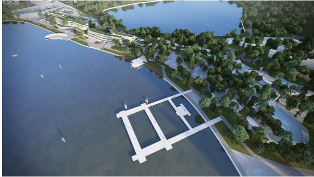
Slika 4 – Trodimenzionalni prikaz kompleksa

Osnovni arhitektonski izraz karakteriše svedena dinamika forme objekata u kompleksu, koji svojom linearnom dispozicijom i u sadejstvu sa prirodnim okruženjem određuju vizuelnu harmoničnost kompleksa.