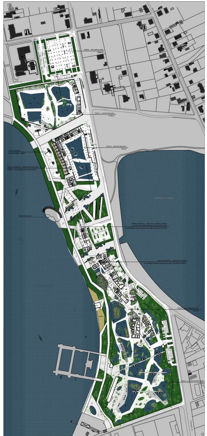
Slika 2 – Osnova prizemlja sa elementima parternog uređenja

prema Palićkom i Krvavom jezeru. Velnes hotel sadrži 109 smeštajnih jedinica (dvokrevetne sobe i apartmani).