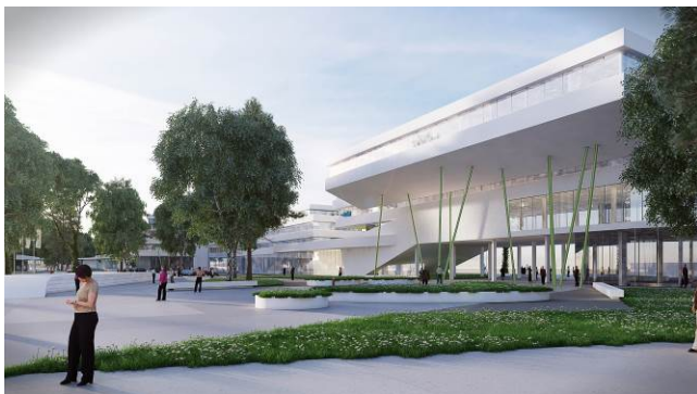
Slika 5 – Trodimenzionalni prikaz kompleksa

Različite funkcionalne zone, homogene materijalizacije (slika 5), integrisane su u jedinstvenu i skladnu prostornu celinu, formirajući novu, autentičnu scenografiju priobalnog pojasa Paličkog jezera.