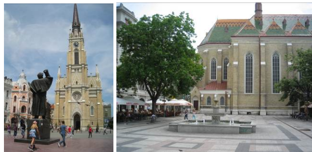
slika 1,2 Crkva Imena Marijina

Čitano sa planimetrije, ova crkva je u urbanom tkivu grada izdvojena jasno kao slobodnostojeći objekat, iako se to ne poklapa s utiskom koji ostavlja na posetioca. Njene fasade čine kulisu za odvijanje najrazličitijih programa i manifestacija, predstavljaju pozadinu za bioskopska platna ili bine za koncerte, čime se događaji oko nje stalno smenjuju. Na taj način, ona se ugradila u kolektivnu memoriju stanovnika i korisnika kako prostora oko nje, tako i njenih posetilaca.