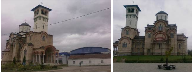
slika 7,8 Crkva Vaznesnja Gospodnjeg na naselju Klisa