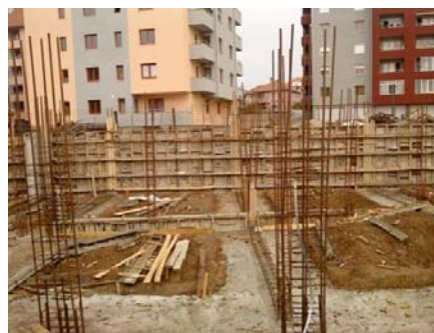
Slika 2 - Oplata podrumskih zidova

Demontaža oplata temelja moguća je sledećeg dana nakon betoniranja. Zbog ograničene količine oplata za betoniranje podrumskih zidova (na objektu S-V), radovi na ovoj poziciji se izvode u tri etape. Svaka etapa podrazumeva montažu oplata za podrumске zidove (slika 2), montažu oplata i armature za vertikalne serklaže i betoniranje podrumskih zidova sa vertikalnim serklažima. Količina radova po etapi približno je jedna trećina ukupne količine podrumskih zidova. Na taj način bi se vršila montaža oplata i armature vertikalnih serklaža prvog dela podrumskih zidova u trajanju od 5 dana, posle čega sledi njihovo betoniranje.