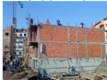
Slika 6 - Prenos materijala (toranjski kran i konzolna dizalica)

Montaža oplata podvlaka, horizontalnih serklaža, stepeništa i terasa (daska debljine 24 mm), i međuspratne konstrukcije (metalni i drveni podupirači, fetne i metalni rešetkasti „hiko“ nosači, kao na slici 7), otpočinje nakon kompletno ozidanog dela objekta (oko dve trećine površine).