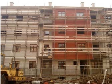
Slika 14 - Izrada „demit“ fasade