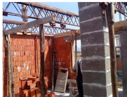
Slika 7 – „Hiko“ nosači kao oplata za izradu MK

Montaža oplata podvlaka, horizontalnih serklaža, stepeništa i terasa (daska debljine 24 mm), i međuspratne konstrukcije (metalni i drveni podupirači, fetne i metalni rešetkasti „hiko“ nosači, kao na slici 7), otpočinje nakon kompletno ozidanog dela objekta (oko dve trećine površine).