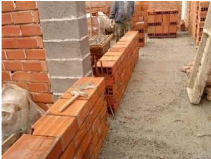
Slika 3 - Zidanje nosećih zidova

Spravljanje maltera, za potrebe zidanja, vrši se na gradilištu mešalicama zapremine 50 i 150 l. Ove mešalice, kao i privremena skladišta materijala potrebnog za spravljanje maltera, nalaze se na delu objekta gde se i vrši zidanje, zbog skraćenja vremena transporta (slika 4). Blokovi se prenose u paletama, toranjskim kranom, od skladišta na gradilištu do mesta zidanja. Istog dana sa početkom zidanja, ili 1-2 dana kasnije, treba otpočeti sa montažom armature i oplata za vertikalne serklaže. Koristi se daščana oplata od dasaka debljine 24 mm.