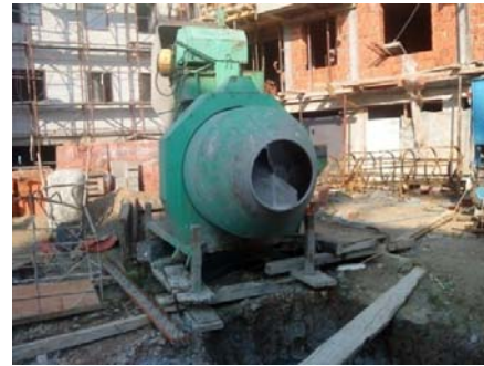
Slika 5 - Spravljanje betona na gradilištu

odgovarajuće visine, rade se nadprozornici i nadvratnici.