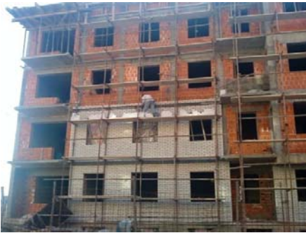
Slika 13 - Oblaganje fasade fasadnom opekom

Fasadnu skelu treba montirati po završetku međuspratne konstrukcije iznad trećeg sprata. Oblaganje fasade fasadnom krečno-silikatnom opekom (slika 13) sa jednovremenom izradom termičke izolacije od mineralne vune, treba početi od prizemlja na više, nakon monaže odgovarajućeg dela skele. Izrada „demit“ fasade (slika 14) počinje lepljenjem i tiplovanjem stiropora i mrežice i to od poslednjeg sprata na niže. Nakon postavljenog stiropora na određenom delu fasade, počinje završno bojenje akrilom u beloj i bordo boji. Vertikalni oluci postavljaju se posle završene fasade na delu objekta gde je njihov položaj projektovan. Fasadna skela može da se demontira po delovima, kako se završava fasada i nakon njene potpune demontaže rade se trotoari oko objekta i uređenje ulaza u objekat.