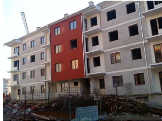
Slika 15- Severozapadna fasada