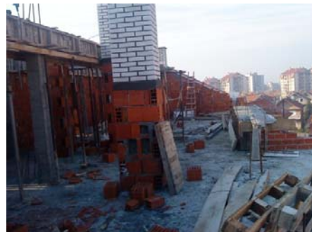
Slika 11 - Dimnjak u tavanskom prostoru