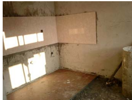
Slika 10 - Keramika u kuhinji

Posle betoniranja međuspratne konstrukcije i greda na tavanu, vrši se izrada krovne konstrukcije, njeno padaščavanje (slika 12), polaganje ter papira, dvostruko letvisanje, montaža horizontalnih oluka i pokrivanje krova.