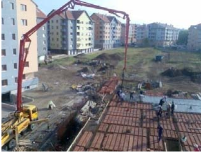
Slika 8 - Betoniranje MK autobetonskom pumpom

Sledećeg dana počinje zidanje naredne etaže, i svi radovi se izvršavaju na isti način. Posle betoniranja međuspratne konstrukcije iznad ove etaže, počinje