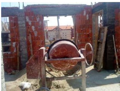
Slika 4 - Spravljanje maltera

Betoniranje vertikalnih serklaža vrši se betonom spravljenim u mešalici za beton, kapaciteta 500 l (slika 5), na samom gradilištu. Za prenos betona služi toranjski kran, ili konzolna dizalica, u slučaju preopterećenja ili kvara kрана (slika 6).