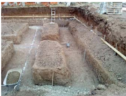
Slika 1 - Razastiranje sloja šljunka

Široki iskop za podrum i iskop za temeljne trake vrši se bagerom sa dubinskom kašikom zapremine 0.5 m 3 , a odvoz iskopane zemlje kiperima zapremine koša 10 m 3 , na deponiju koja je udaljena od gradilišta 2 km. Posle iskopa razastire se sloj šljunka kao tampon ispod temelja (sl. 1), preko koga se radi sloj mršavog betona. Šljunak se prevozi, od skladišta na gradilištu do temelja, ručnim kolicima, razastire se u temeljne jame i vrši zbijanje vibro-nabijačima.