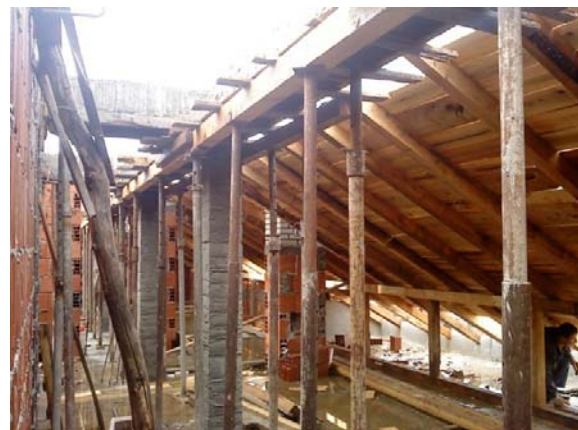
Slika 12 - Padaščavanje krovne konstrukcije