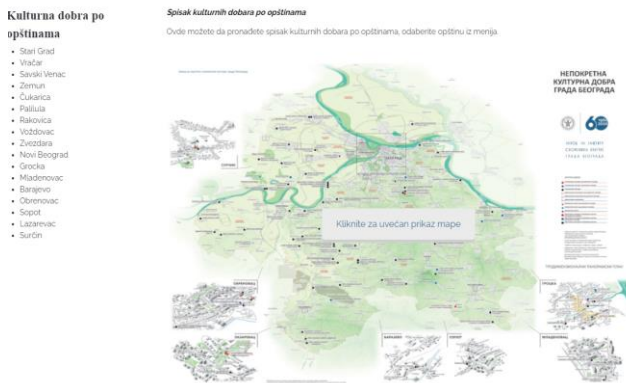
Slika 2. Na geografsko-topografskim mapama prezentovana su kulturna dobra sa svojom lokacijom, vizuelnim prikazom i sažetim opisom

nasleđa beogradskih opština i javnih spomenika. Slika 2. [3]