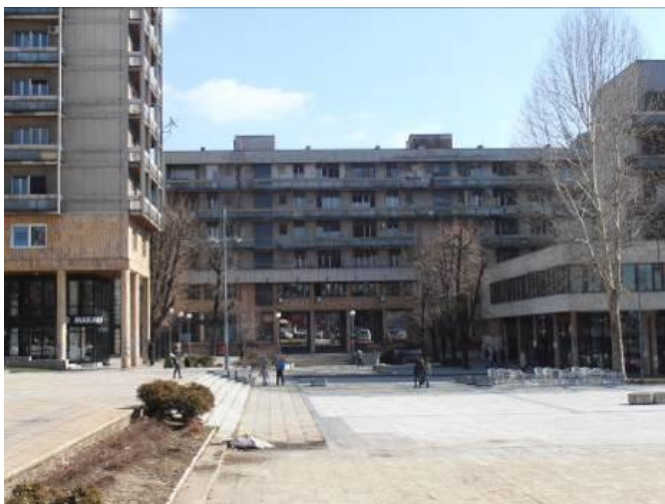
Slika 5a, 5b. Trg partizana, plato ispred bronzane figure (1961) i savremeno stanje (2014)

Severni plato Trga partizana je prostor između Narodnog pozorišta, Narodne biblioteke i Pošte. Prostor je oblikovan tako da je istovremeno i samostalan i uključen u celinu Trga. Sastoji se od: donjeg i gornjeg nivoa, potpornog zida i manjih