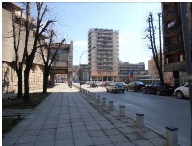
Slika 3a, 3b. Trg partizana, plato ispred Narodnog pozorišta (1961) detalj (2014)

Parter je organizovan u četiri platoa koji su u blagom nagibu i međusobno povezani stepeništima. Nalazi se između od kote 408,27 do 412,85 (4,58 m). Podužni padovi su 1,8%, 1,26%, 1,47% i 1,32%. Parter iznad ulice Kralja Petra se nalazi na koti 412,85 do 417,79. Mada je projekat rađen 1958. godine svi prilazi objektima su projektovani sa pristupnim