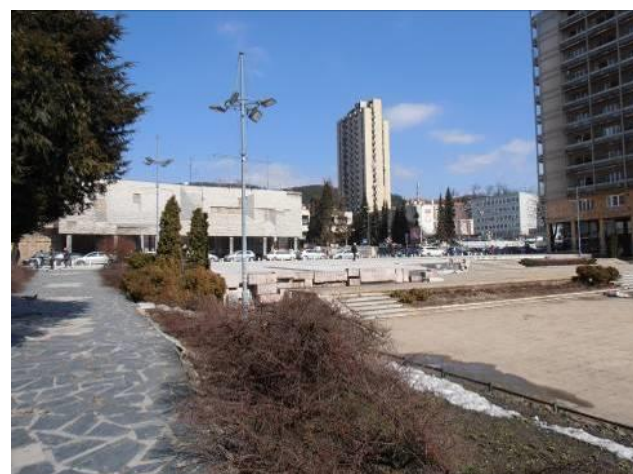
Slika 4a, 4b, 4c. Trg partizana, plato iza bronzane figure (1961) i savremeno stanje (2014)

Na oblikovanje Partera na Trgu partizana je uticalo nekoliko okolnosti: na severu prostor trga je podeljen ulicom Kralja Petra Prvog jer nije bilo moguće izmestiti saobraćaj u drugu ulicu. Zatim, topografija