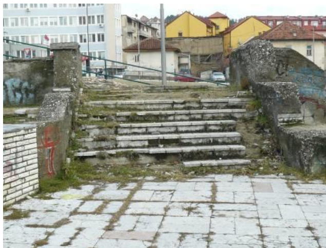
Slika 6a, 6b. Trg partizana, zapadni plato kod Pošte (1961) i savremeno stanje (2014)