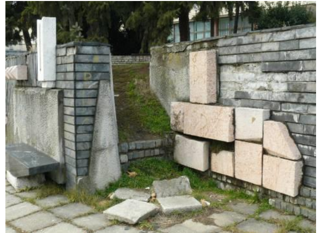
Slika 2a, 2b, 2c. Trg partizana, plato između Narodnog pozorišta i Pošte (1961) i detalji (2014)

Nivelacija i obrada površina na Trgu su rezultat potreba pešačkog i mirujućeg saobraćaja. Prostor Trga je po visini rasčlanjen u pet platoa (sa jednim ili više podnivoa) koji se pružaju od severa ka jugu. Kroz parter prolazi nekoliko pešačkih staza a da pri tome ne