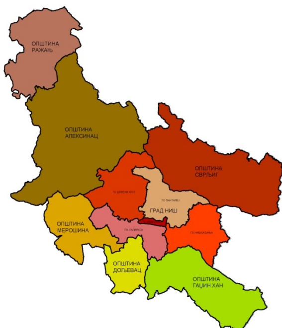
Slika 1: Opštine Nišavskog upravnog okruga

Prema podacima Agencije za privredne registre od 2.12.2017. godine, samo Grad Niš pripada I grupi lokalnih samouprava kod kojih je stepen razvijenosti iznad republičkog proseka, dok sve ostale opštine pripadaju IV kategoriji kod kojih je stepen razvijenosti ispod 60% republičkog proseka.